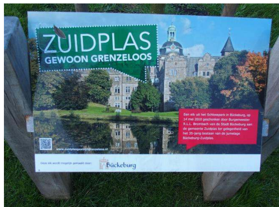
Foto op zolderexpo Oudheidkamer en bord '35-jarig bestaan van de jumelage Bückeburg-Zuidplas', 2014