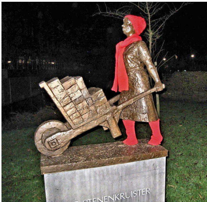
Stenenkruister tijdelijk NIET barvevoets